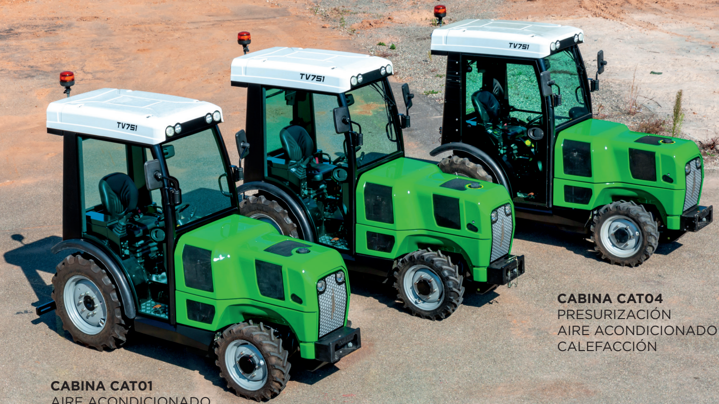
CABINA CAT01 AIRE ACONDICIONADO CALEFACCIÓN